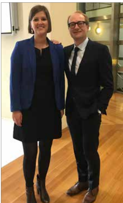
Vlaams minister Ben WEYTS investeert in de Duffelse mobiliteit.

De mobiliteit in Duffel is heel belangrijk voor de N-VA. Als het om wegen gaat die beheerd worden door Vlaanderen blijven we zowel vanuit het gemeentebestuur als via Sofie in het Vlaams Parlement bij minister Weyts de Duffelse belangen behartigen. En met resultaat, zo blijkt uit volgende dossiers.