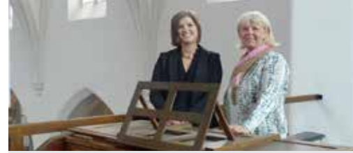
Extra orgelpijpen voor Duffels groot orgel (p. 3)