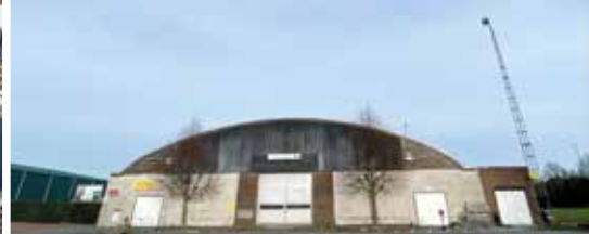
Gemeente koopt domein De Pollepel aan (p. 3)