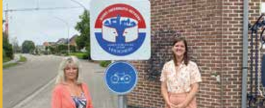
Zesde buurtinformatienetwerk van start (p. 2)