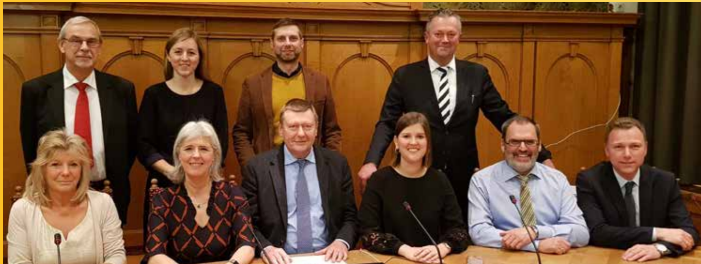
De N-VA-gemeenteraadsleden maken de komende jaren werk van een nog mooier Duffel.

Met N-VA Duffel mee aan het roer maakt het gemeentebestuur de komende jaren werk van een ambitieus bestuursakkoord. Het akkoord bestaat uit heel wat krachtlijnen die Duffel de komende jaren nog mooier zullen maken. Een overzicht: